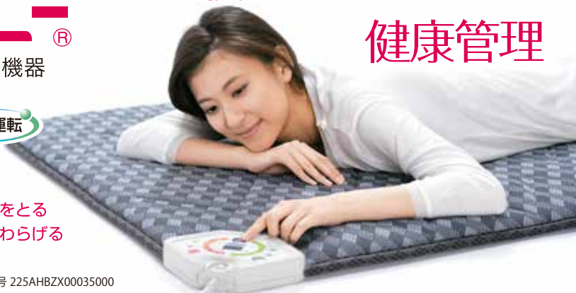
ローズテクニー JNR-1004 サイズ 100×200cm 本体価格 228,000円+税 管理医療機器・認証番号 225AHBZX00035000