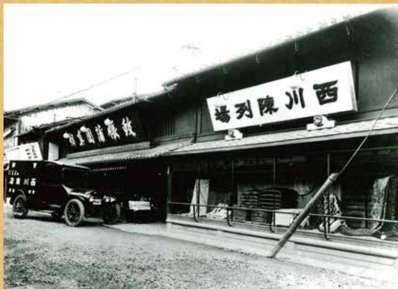
▲大正末期～昭和初期頃 店舗外観（寺町通り松原上る）

京都西川は、1566年に近江国（滋賀県）で創業した西川甚五郎商店の京店をルーツとしており、本年、西川創業450年の記念の年を迎えることとなりました。これもひとえに多くの方々に西川製品をご愛顧いただきました賜物と衷心より感謝申し上げます。